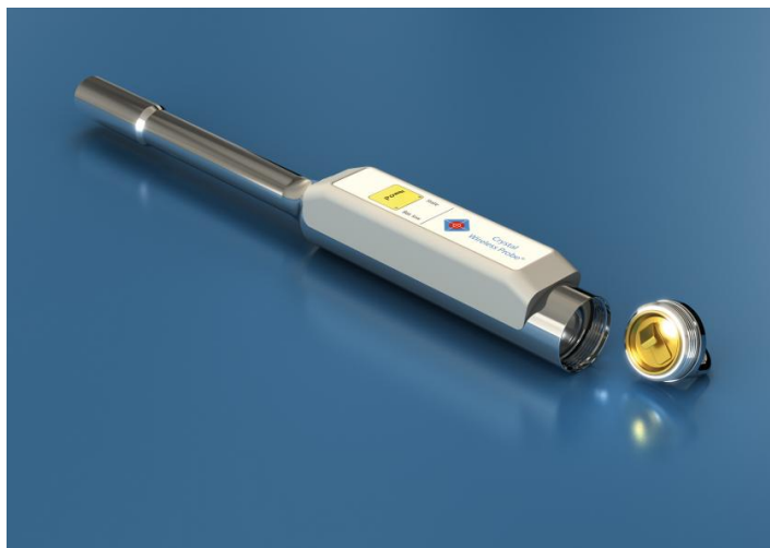
Abb. 3: Funksonde mit geöffnetem Batteriefach

Achtung: Sollte die Sonde noch im „Bat-low-Modus“ arbeiten, ist die Sonde vor dem Batteriewechsel unbedingt mittels Taster auszuschalten.