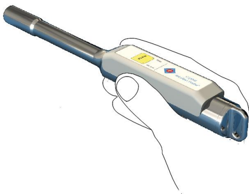
Abb. 4: Korrekte Handhabungsweise der Sonde

Wichtiger Hinweis: Die Sonde ist stets wie ein Bleistift in die Hand zu nehmen. Keinesfalls darf mit der Hand der Kunststoffaufsatz abgedeckt werden, da das zum Abriss der Funkverbindung zum SG04 führen kann und die Status-LED's nicht mehr sichtbar sind!