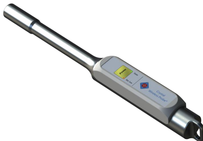
Abb. 1: Funksonde

Die Funksonde ist mit einem Edelstahl-Sondengehäuse, einem Edelstahl-Batteriefach-Verschluss und einem Kunststoffaufsatz mit integrierter Folientastatur und zwei integrierten LED's aufgebaut.